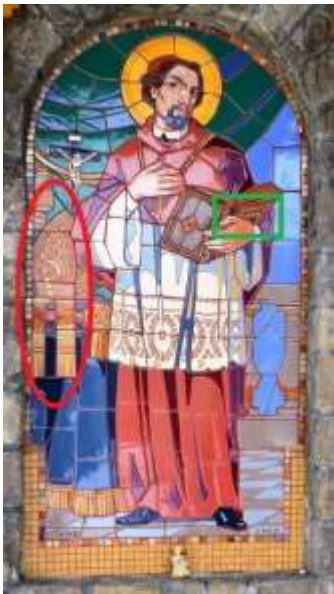
Svätý František Saleský

Apoštol svätý Tomáš má atribúty ako je kopija, meč alebo staveľský uholník, preto je aj patrónom stavbárov, tesárov, ale aj zememeračov. Postava na mozaike vpravo má v ruke kopiju, takže to dokladá, že na mozaike vpravo je zobrazený apoštol sv. Tomáš.