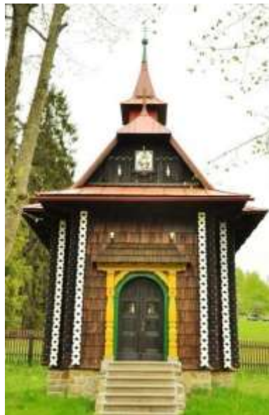
Kaplnka sv. Cyrila a Metoda v obci Bílá

Nielen v architektúre sa dielami významných autorov inšpirujú jeho nasledovníci ale aj nezmámi umelci. V obci Bílá, na severnej Morave, blízko slovenských hraníc je malá kaplnka sv. Cyrila a Metoda asi tiež inšpirovaná drevenými stavbami Dušana Jurkoviča