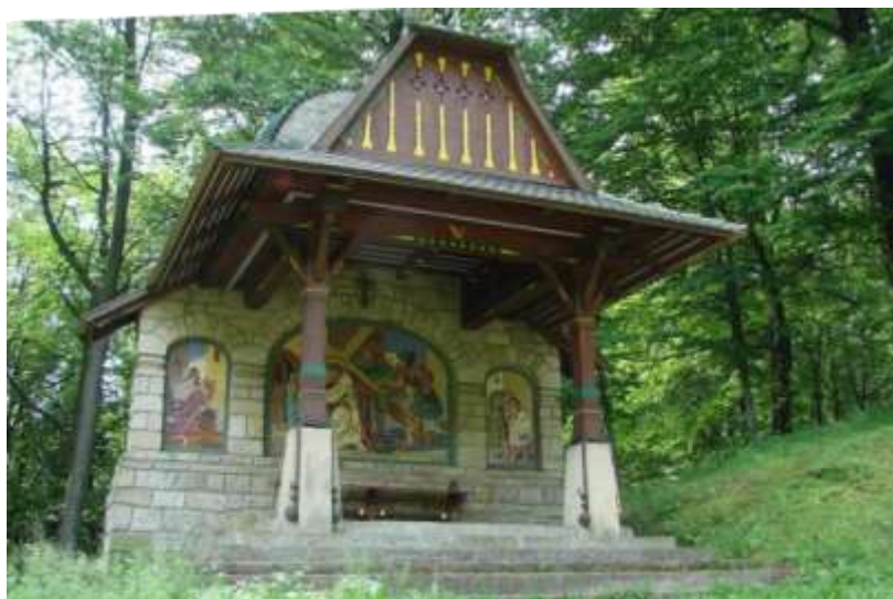
Piate zastavenie krížovej cesty na Hostýne, autor Dušan Jurkovič

Architekt Dušan Jurkovič veľa cestoval a inšpiroval sa drevenými stavbami najmä na Moravskom Valašsku a západnom Slovensku. Využíval v svojich stavbách drevené prvky a tvoril v geometrickom secesnom štýle, ktorý spojil s ľudovými motívmi. Navrhol aj krížovú cestu na pútnickom mieste Hostýn [4], [5].