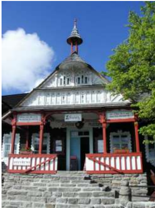
Chata Libušíň na Radhošti v roku 2013, architekt Dušan Jurkovič

-37 projektoval tiež Dušan Jurkovič [3]. Dolná budova stanice lanovky od Dušana Jurkoviča v Tatranskej Lomnici, po vybudovaní novej lanovky, je ale už mimo prevádzky. Zoznam jeho diela je rozsiahly, napr. kúpeľné domy v kúpeľoch Luhačovice, Spolkový dom v Skalici, alebo súbor drevených turistických stavieb na Radhošti. Na Radhošti v roku 2014 vyhorela veľmi krásna stavba, chata Libušíň, ktorá bola v roku 2020 po rekonštrukcii znovu otvorená.