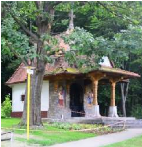
Kaplnka Sedembolestnej Panny Márie v Lesoparku Chrasť

Lesopark Chrasť je známe miesto pre prechádzky v okolí Žiliny, ktoré po úprave s výstavbou detských ihrísk a cyklotrás získalo na atraktivite. Pri vstupe do Lesoparku je pekná kaplnka Sedembolestnej Panny Márie. Možno ste si všimli, že kaplnka má zaujímavo zdobenú architektúru a vo vnútri mramorovú sochu Piety. Čo na malú kaplnku nie je bežné. Kaplnka bola v roku 1991 rekonštruovaná a patrí pod farnosť Žilina Vlčince. Všeobecne známe informácie sú uvedené v popisoch pamiatok Žiliny [1].