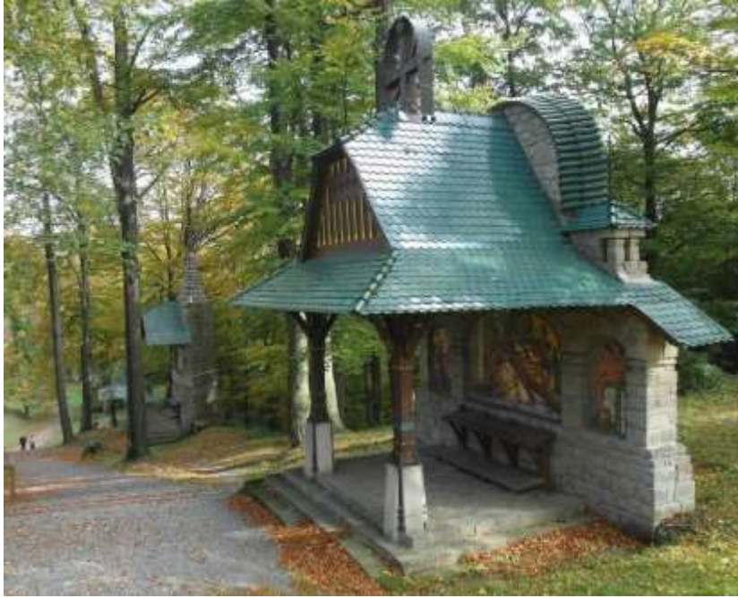
Křížová cesta od Dušana Jurkoviča na Hostýne

Nielen v architektúre sa dielami významných autorov inšpirujú jeho nasledovníci ale aj nezmámi umelci. V obci Bílá, na severnej Morave, blízko slovenských hraníc je malá kaplnka sv. Cyrila a Metoda asi tiež inšpirovaná drevenými stavbami Dušana Jurkoviča