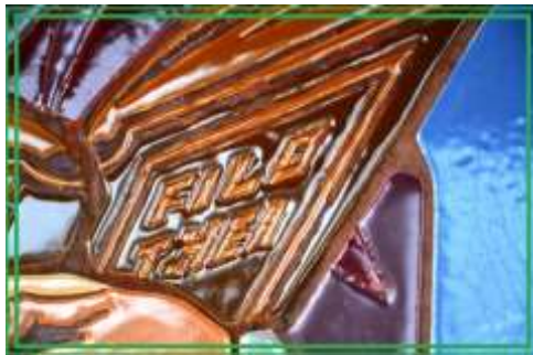
Detail mozaiky s nápisom FILOTHEA