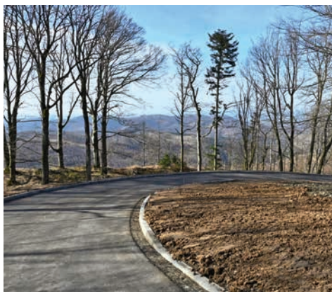
Nová asfaltová silnice je již téměř hotová a vede od poutních domů k točně autobusů.

Na točně bylo provedeno nové dopravní značení, vodorovné i svislé, které náležitě prověří budoucí praxe. Středová zpevněná plocha točny bude nově sloužit k parkování až šesti autobusů. Po obvodu točny byly vybudovány nové chodníky pro pěší, včetně všech prvků pro zabezpečení pohybu osob se sníženou schopností pohybu a orientace. V místě nástupní zastávky se vybuďoval betonový základ pro nový přístřešek, který zajistí ochranu v nepříznivém počasí. V poslední lednový den byla stavebním úřadem MěÚ v Bystřici pod Hostýnem provedena kolaudační prohlídka, stavba zkontrolována a po předložení všech požadovaných dokladů a podkladů dne 20. 2. 2023 vydán kolaudační souhlas.