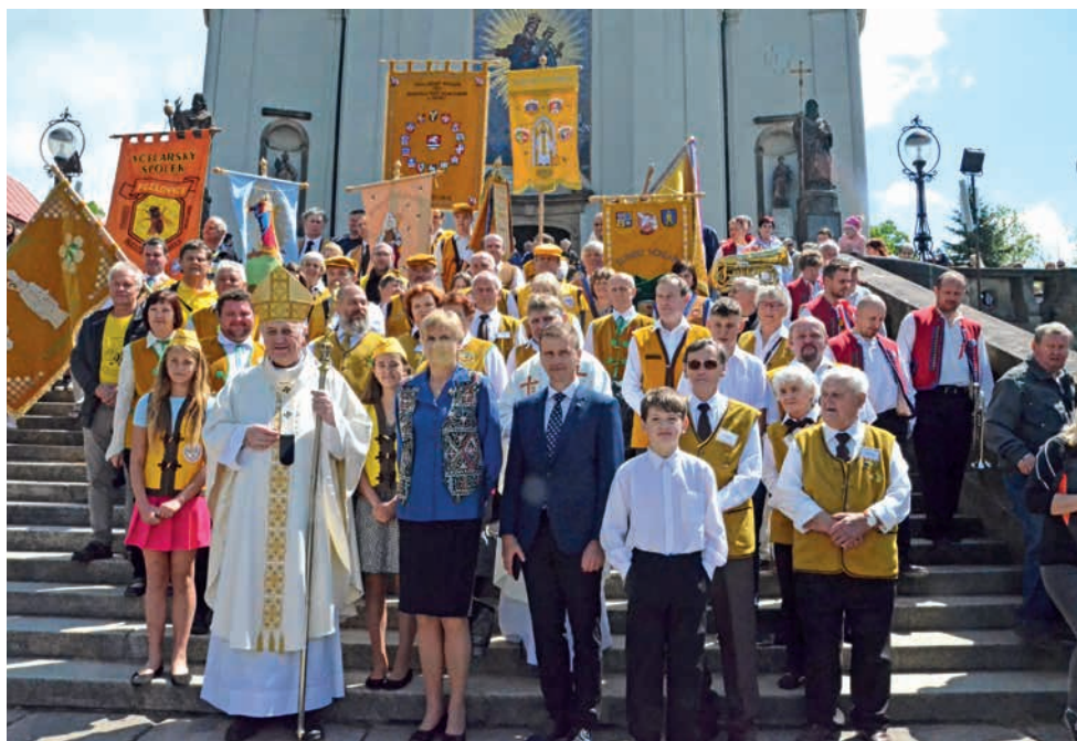
Praporům včelařských spolků i krojům dominuje na včelařské pouti medová barva.

Když je v máji včelařská pouť na Svatém Hostýně, hučí to okolo baziliky a poutních domů jako v úlu. Dvoudenní událost patří k nejnavštěvovanějším slavnostem na mariánském poutním místě. Přijíždí na ni až 10 tisíc lidí, a to už je pořádný roj. Český svaz včelařů organizuje letošní již 20. pouť o víkend 20. a 21. května. A jsou na ni zváni nejen ti, kdo včelky chovají, ale také všichni, kdo si váží jejich práce a medem či medovinou si rádi osladí život.