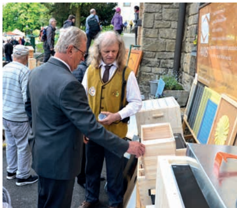
V okolí baziliky a poutních domů je během pouti řada stánků s výrobky medu, propolisu nebo včelího vosku. Nechybí ani potřeby pro chovatele.

Jak bude letošní pouť na Svatém Hostýně vypadat? Hlavním poutním dnem je neděle 21. května. Nejprve se u sochy sv. Ambrože, patrona včelařů, která je o roku 2007 usazena po pravé straně baziliky, shromáždí krojovaní včelaři se spolkovými prapory, po jejich požehnání vyjdou průvodem a slavnostně vejdou do kostela. Mše