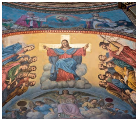
Stropní malba v bazilice Panny Marie Nanebevzaté na Svatém Hostýně s vyobrazením vzkříšeného Krista.

Zanedlouho bude zahájena oficiální poutní sezóna na Svatém Hostýně, za jejíž požehnaný průběh se jako každý rok modlíme a v nějž věříme. Přicházet však můžete ještě předtím. Například na oslavu největších křesťanských svátků, Velikonoc, jejichž požehnané prožití vám všem ze srdce přejeme! Kromě poutí chystáme i na letošní rok, jak jinak, rekonstrukční práce. Matice svatohostýnská se zaměří například na vybudování lepšího parkoviště u poutních domů, na němž ústí nová cesta od autobusové točny (to bude bohužel znamenat ne stoprocentně řešitelný parkovací diskomfort). My, duchovní správa, máme v plánu mimo jiné opravu fasády a střechy kaple sv. Jana Sarkandra, jejíž interiér už opravený je, dořešení sedacího mobiliáře baziliky, dětský