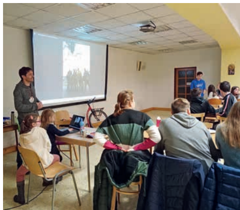
Plnění Svatohostýnské výzvy děkanátem Zlín.

Z hlediska mládeže Přerov možná nepatří mezi nejživější a nejpočetnější děkanáty, avšak mladí tu jsou. A setkávají se. Jako pomyslný pilíř mládežnických akcí jsou u nás takzvané modlitby mládeže. Co měsíc to jiná farnost, různorodá modlitba v kostele, posezení na faře obvykle i s menší aktivitou či hrou. Kromě „modliteb“ jsou stálými akcemi i herní večery a výlety, obvykle jednou do roka. Tradiční je také adventní nebo postní duchovní obnova. Snažíme se i experimentovat, úspěch přinesl třeba taneční večer a letní kino.