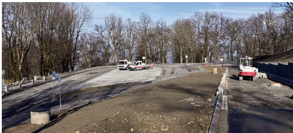
Pohled na novou točnu autobusů, z níž vychází nová přístupová komunikace k poutním domům.

To nás ještě čeká také u nové komunikace. Tam se dokončovaly terénní úpravy povrchů, opravy dláždění, úpravy kanalizačních vpustí. Dle možností v rámci sadových úprav probíhalo částečné zatravnění bezprostředního okolí. Do konce března by vše mělo být hotovo. Krátce