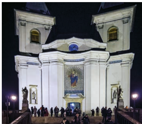
Silvestrovské putování na Svatý Hostýn s půlnoční mší svatou v roce 2017.

Ano, letošní Vánoce budou opět vzrušující i jinak, než bychom chtěli. Ale právě zde se má projevat naše křesťanská víra: Nebýt překvapený z toho, že náš hříchem poškozený pozemský svět není nebe a že