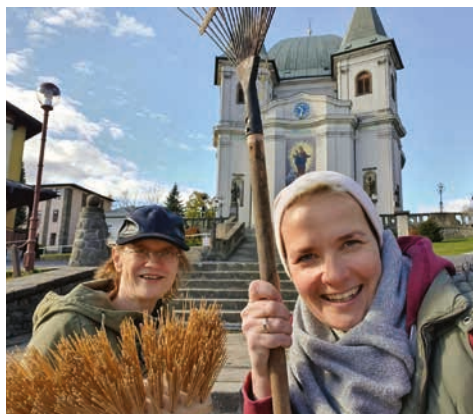
Brigádníci na Svatém Hostýně.

Několik mužů se zase pustilo do namáhavého čištění ucpaných kanalizačních vpustí a zanesených revizních šachet kanalizace, která odvádí srážkové vody z vrcholu posvátné hory. To si ještě vyžádá další pokračování v podobě revize celého kanalizačního sys-