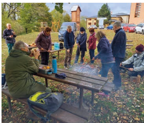
Na dvoudenní brigádu dorazili 22.- 23. října pomocníci z pražské farnosti Matky Boží před Týnem.