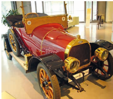
Jak vypadal „laperdón“ z příběhu „malého neplecháře“ se nedozvíme. Popisu chlapce však odpovídá německý automobil Opel Torpedo z roku 1911.

„Nerozumíš?“, kývali po mňa takéj hlavu a pohlédli na tých, co sedali ve fasaňku. Tí sa zabočili a zavolali na ně ménem, tuším „Hermidýn“ sa volali. A tí chlapisko drapli