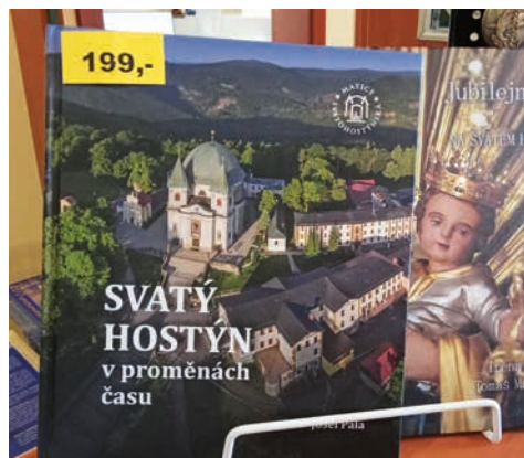
Na recepci i v e-shopu Matice svatohostýnské najdete nejen tipy na dárky pod stromeček.

Na hostýnské recepci nechybí ani něco dobrého na zub. Pochutnat si můžeme