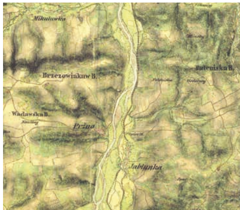
Událost popsaná v příběhu se odehrává na vsetínské cestě z Valašského Meziříčí do Vsetína. Mapa z 19. stol.

„Tož to neé“, dolekal sem sa jeho nápadu. „Húsata sú moje, peníze též, a tož bicígel ti edem poščám, scěš-li.“