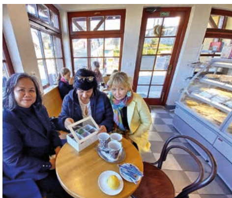
Velvyslankyně Indonésie Kenssy D. Ekaningsih navštívila ve čtvrtek 28. října poutní baziliku i cukrárnu.