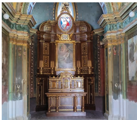
Interiér kaple sv. Jana Sarkandra na Svatém Hostýně.

sel opět pracně odnášet a znovu instalovat. V takovém případě by kaple nebyla k dispozici ani v příští poutní sezóně. Vše bude záležet na poskytnutí či neposkytnutí dotací, případně na finančních možnostech Duchovní správy. Pokud by renovace fresek na jaře začala, kaple by byla plně funkční v přespříští poutní sezóně. Pokud by se odložila na později, kaple by se na jaře osadila mobiliářem a v příští sezóně by k dispozici byla. Výhledově se dále počítá s menšími opravami fasády a obnovou nátěru střechy, protože přes relativní novost zde klimatické podmínky a vlhkost již také udělaly své. Tolik základní přibližení situace. A možná i malé upozornění pro řidiče bez průkazu ZTP: Kaple se nachází v zóně zákazů vjezdu, k parkování slouží přednostně jiná prostranství. Děkujeme za pochopení!