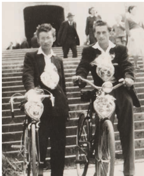
O mnoho let později, než se odehrál tento příběh z Valaš- ska, se staly „bicigle“ běžným dopravním prostředkem. Na dobovém snímku jsou zachyceni dva poutníci z Trnavy u Zlína před bazilikou.

„Jaké vracáňá?“ Patnáct rynských si vrátil už, a lesti sa hdy bude hdo ešče hlásit, tož mu dám ty dva ryncké, a pro ostatek ať si ide za tými, co vzali peníze neprávem.“ Ta-