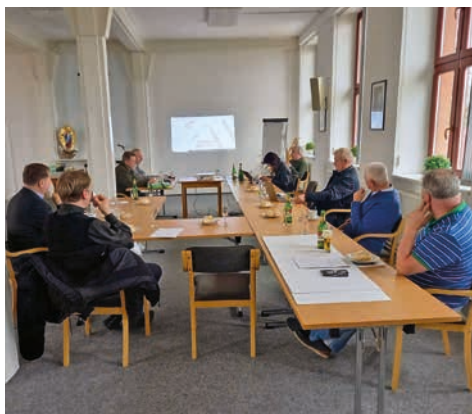
Členové Výboru MSH při jednání.