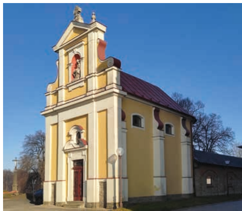
Kaple sv. Jana Sarkandra na Svatém Hostýně.

Mnozí z vás poutníků jste se možná letos zastavovali u kaple sv. Jana Sarkandra, která stojí coby první stavba nalevo od baziliky v rámci komplexu budov kolem ní. Byla buď zavřená, nebo se v ní pracovalo. Není od věci informovat o jejím budoucím osudu, protože je již dlouho mimo provoz a mnohé z vás by jistě zajímalo, zda a kdy k využití opět bude. Tedy: Brněnská restaurátorská firma Tabernákl letos dokončila renovaci mobiliáře. Pracovníci firmy manželů Bodanských opravili vnitřní omítky v dolní části zdí, které byly již z velké části díky vlhkosti opadané. Ty budou přes zimu vysychat. Zda bude kaple funkční v příští sezóně, závisí na tom, jak se rozhodne o dalším postupu. Fresky v kapli sice ještě nejsou ve vyložené havarijním stavu, ale restaurování potřebují. Praktické by bylo restaurovat je ještě před vrácením mobiliáře do celé kaple, aby se poté nemu-