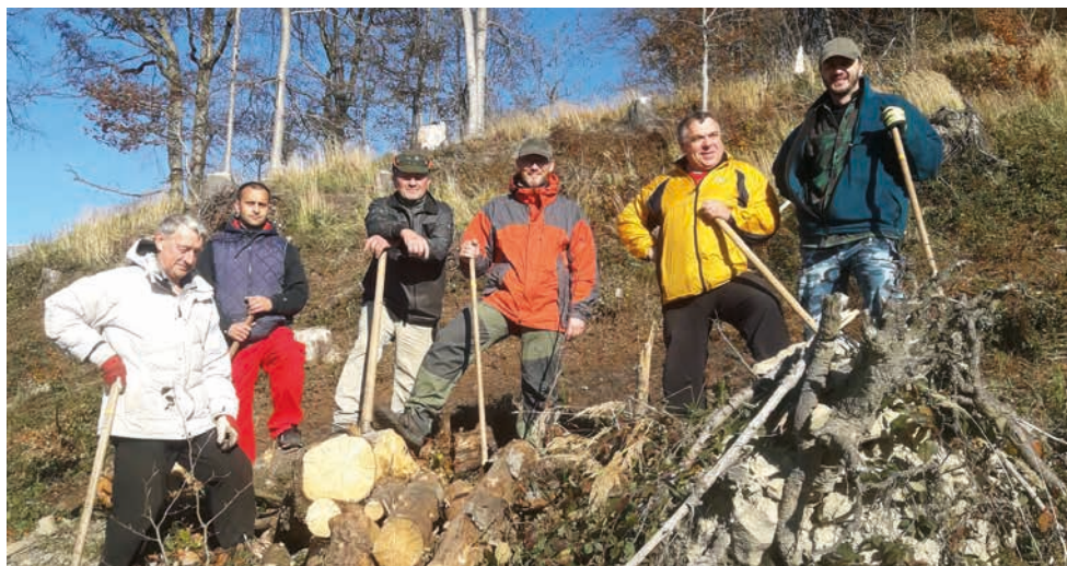
Parta mužů z Bystřice pod Hostýnem se v pátek 29. října zapojila do obnovy lesa po kůrovcové těžbě.

Duchovní správa vyslovuje velké poděkování mužům z farnosti Brumov-Bylnice za velkou pomoc při likvidaci kůrovcového dřeva a vývratů na Svatém Hostýně.